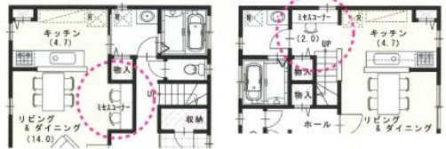
<参考プラン> No.07 (HW-S105)