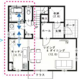
<参考プラン> No.25 (HW-EV102)